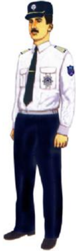
Şəkil 2. uzunqol köynəkdə gündəlik yay geyim formas ı