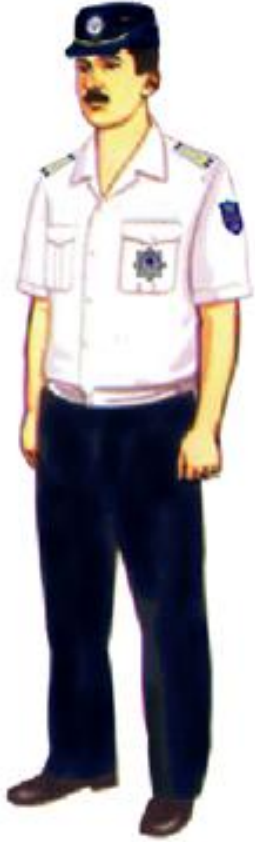
Şəkil 1. qısaqol köynəkdə gündəlik yay geyim formas ı