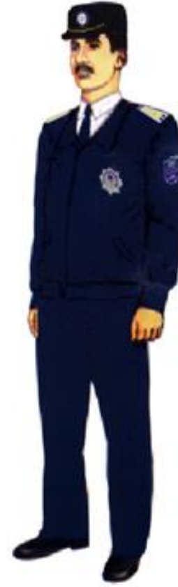
Şəkil 4. demisezon gödəkcədə gündəlik qış geyim formas ı