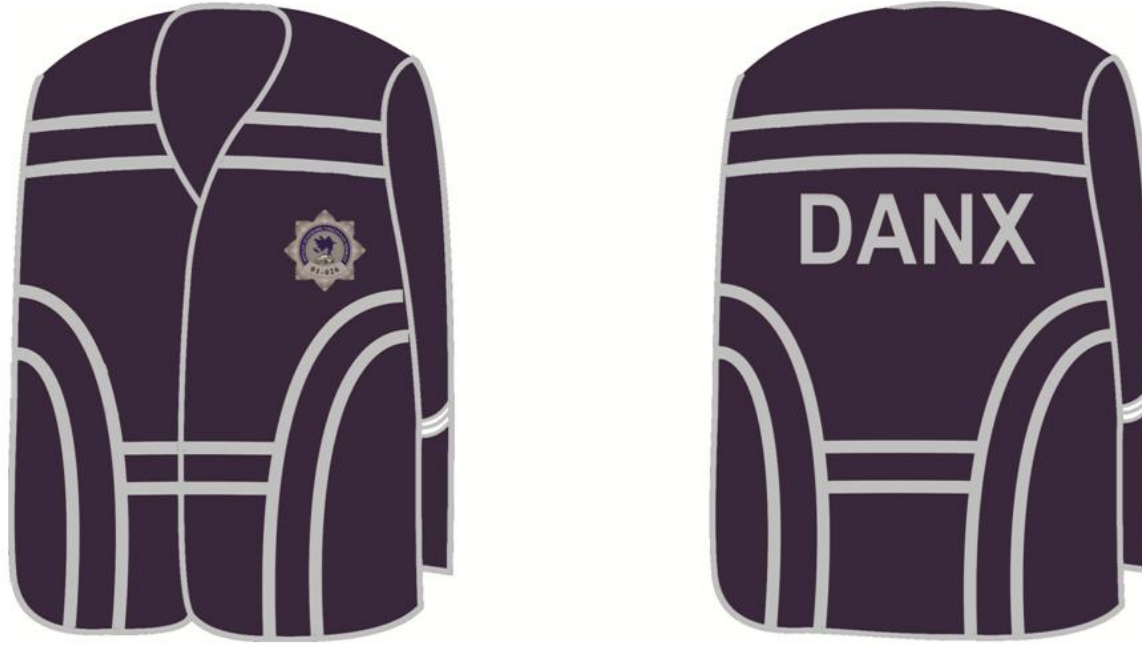
Şəkil 16. Örtük