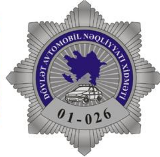
Şəkil 13. Fərqləndirmə döş nişanı (jeton)