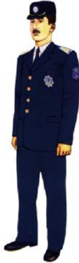
Şəkil 3. pencəkə gündəlik yay geyim formas ı