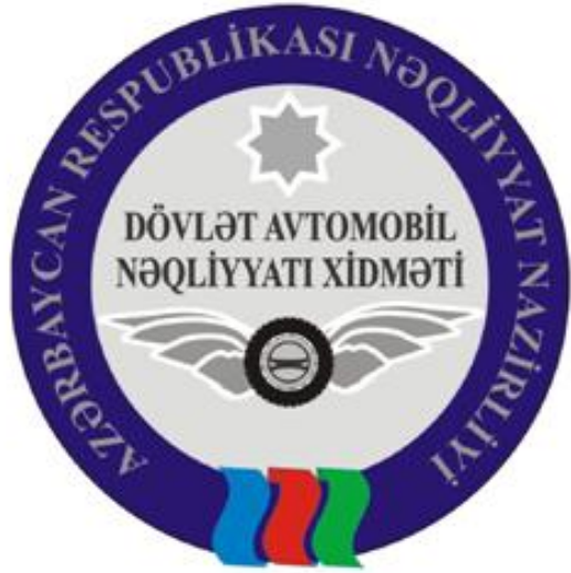
Şəkil 11. Kokarda (emblem)