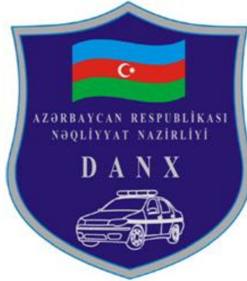
Şəkil 12. Fərqləndirmə qol nişanı (şevron)