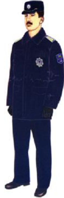
Şəkil 5. qış gödəkcəsində gündəlik qış geyim formas ı